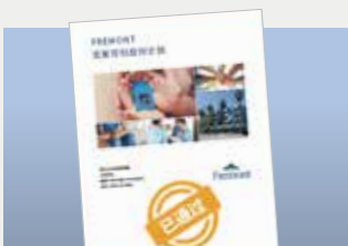
无家可归应对计划