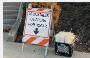
Recursos para la temporada invernal 6