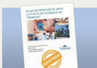
Respuesta ante la falta de vivienda 3