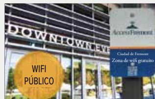
Acceso al wifi público de Fremont 4