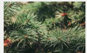
Árboles de Navidad 9